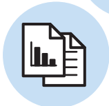
ワークシートや グラフ