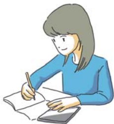
課題に対する自分の考えを まとめる