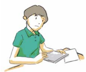
保存データを呼び出し 学習のふりかえり

●本カタログ掲載の製品の名称およびロゴはそれぞれ各社が商標として使用している場合があります。●Windows は、米国 Microsoft Corporation の、米国およびその他の国における登録商標または商標です。●Intel、インテル、Intel ロゴ、Intel Atom、Intel CoFluent、Intel Coreは、アメリカ合衆国および / またはその他の国における Intel Corporation またはその子会社の商標または登録商標です。●デジタルノート@クリエイターズは、株式会社fuzzの登録商標です。