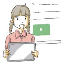
電子黒板やプロジェクターに 映して発表