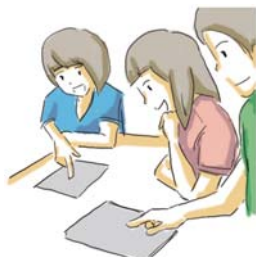
グループでの協働学習に